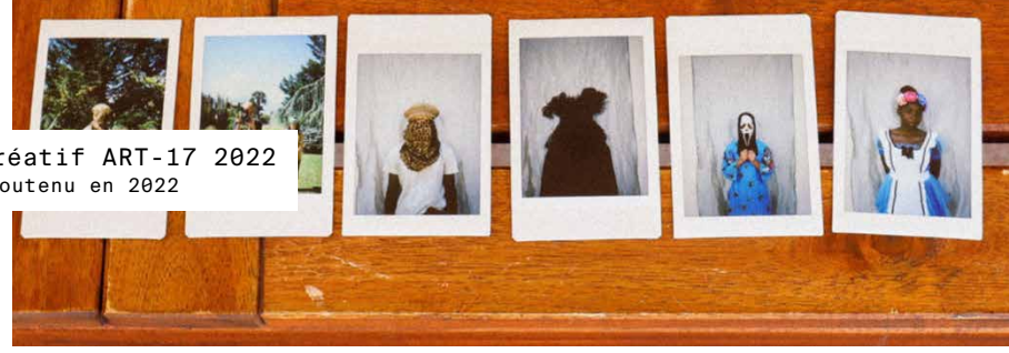
Camp créatif ART-17 2022 projet soutenu en 2022