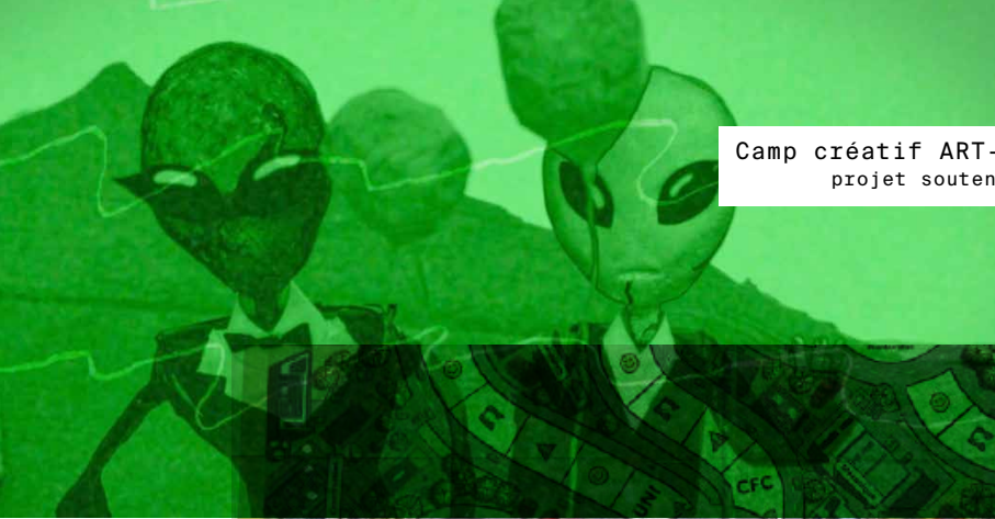
Camp créatif ART-17 2023 projet soutenu en 2023