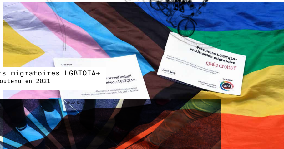
Parcours migratoires LGBTQIA+ projet soutenu en 2021