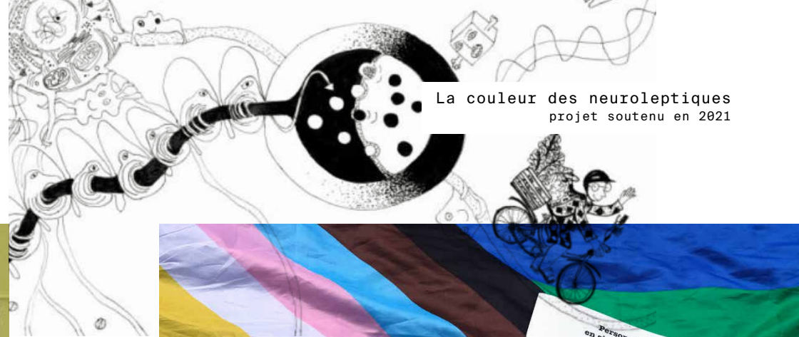
La couleur des neuroleptiques projet soutenu en 2021