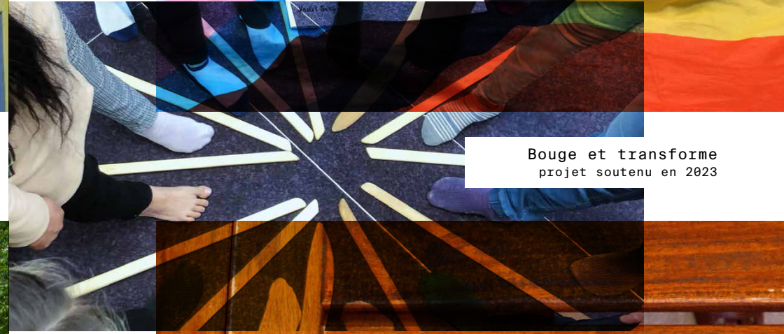
Bouge et transforme projet soutenu en 2023